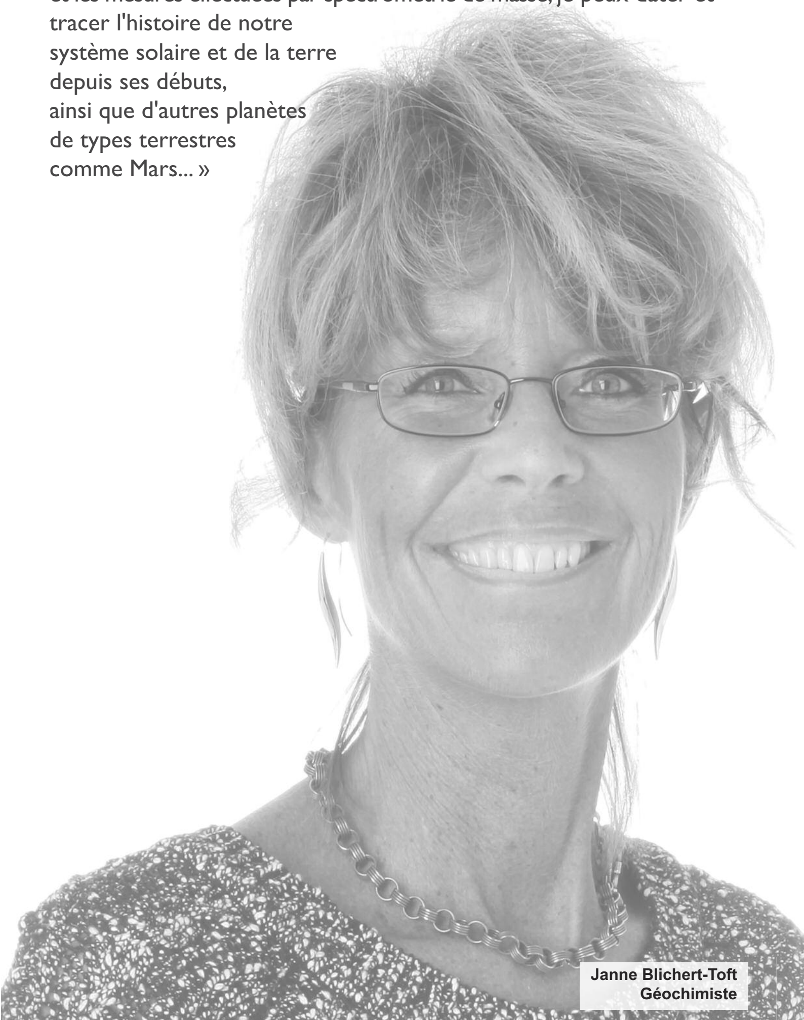
Janne Blichert-Toft Géochimiste

et les mesures effectuées par spectrométrie de masse, je peux dater et tracer l'histoire de notre système solaire et de la terre depuis ses débuts, ainsi que d'autres planètes de types terrestres comme Mars... »